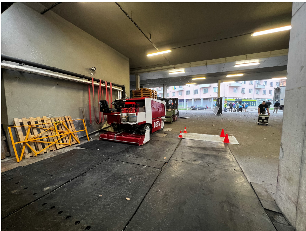
Stávající ledová plocha a mantinely